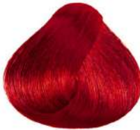
قرمز آتشین تیره متوسط Dark Intense Red Blonde Biondo Scuro Rosso Intenso