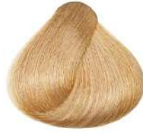
طلایی خیلی روشن Very Light Golden Blonde Biondo Chiarissimo Dorato