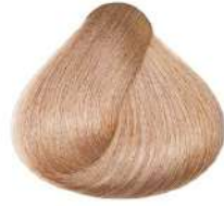
بادامی خیلی روشن Very Light Golden Brown Blonde Biondo Chiarissimo Dorato Marrone