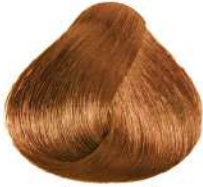
شنی طلایی روشن Light Golden Sandy Blonde Biondo Chiaro Dorato Sabbia