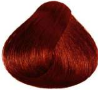
مسی تیره متوسط Dark Copper Blonde Biondo Scuro Rame