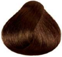
طلایی خیلی تیره Golden Brown Castano Dorato