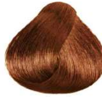
شنی روشن Light Sandy Golden Blonde Biondo Chiaro sabbia Dorato