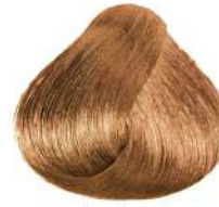
شنی خیلی روشن Very Light Sandy Golden Blonde Biondo Chiarissimo Sabbia Dorato