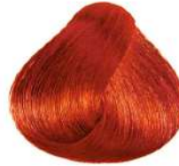
مسی روشن Light Copper Blonde Biondo Chiaro Rame