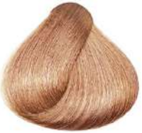
بلوند صورتی Pinky Blonde Biondo Rosato