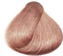
بلوند مرواریدی Pearl blonde Biondo Perla