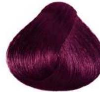
بادمجانی غلیظ Intense Violet Blonde Biondo Viola Intenso