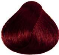
ماهاگونی تیره Light Red Irisé Brown Castano Chiaro Rosso Irisé