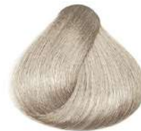
بلوند خاکستری فوق العاده روشن Very Light Extra Grey Blonde Biondo Chiarissimo Extra Grigio

Usage ratio for ultra lightener: میزان ترکیب رنگ به اکسیدان برای بلوندهای خیلی روشن: