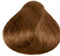
طلایی تیره متوسط Dark Golden Blonde Biondo Scuro Dorato