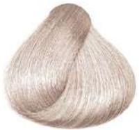
بلوند زیتونی مرواریدی فوق العاده روشن Extra Light Pearl Cendre Blonde Biondo Chiarissimo Extra Perla Cendrè