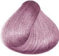
بلوند دودی بژ فوق العاده روشن Very Light Extra Ash Irisé Blonde Biondo Chiarissimo Extra Cenero Irisé