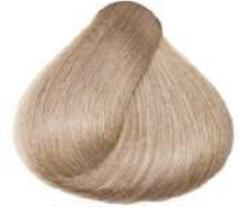
بژ طلایی فوق العاده روشن Extra Light Irisé Golden Blonde Biondo Extra Chiaro Irisé Dorato