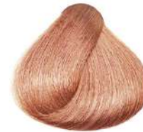
بلوند نقره ای Silver Blonde Biondo Argento