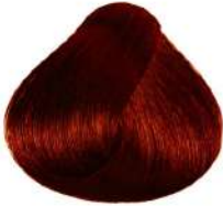
مسی تیره Light Copper Brown Castano Chiaro Rame