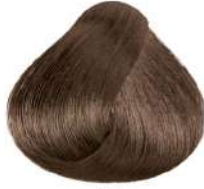
بژ طلایی Irisé Golden Blonde Biondo Irisé Dorato