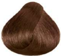
بادامی تیره متوسط Dark Golden Brown Blonde Biondo Scuro Dorato Marrone