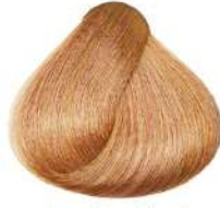
شنی طلایی خیلی روشن Very Light Golden Sandy Blonde Biondo Chiarissimo Dorato Sabbia