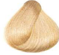
طلایی فوق العاده روشن Extra Light Golden Blonde Biondo Extra Chiaro Dorato