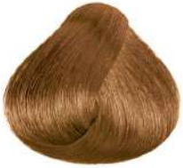
طلایی Golden Blonde Biondo Dorato