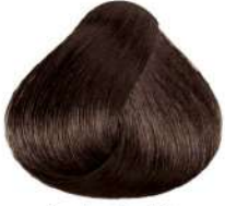
بژ طلایی تیره متوسط Dark Irisé Golden Blonde Biondo Scuro Irisé Dorato