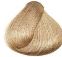
بلوند دودی فوق العاده روشن Extra Light Ash Blonde Biondo Chiarissimo Extra Cenero