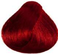
شرابی تیره Light Intense Red Brown Castano Chiaro Rosso Intenso