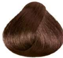
شکلاتی تیره متوسط Dark Intense Brown Blonde Biondo Scuro Marrone Intenso