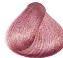
بلوند رز Rose Blonde Biondo Rosé