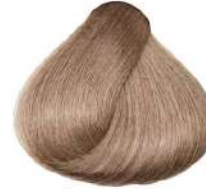
بژ طلایی خیلی روشن Very Light Irisé Golden blonde Biondo Chiarissimo Irisé Dorato