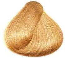
بلوند طلایی فوق العاده روشن Extra Light Golden Blonde Biondo Chiarissimo Extra Dorato