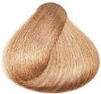
مرواریدی Pearl perla