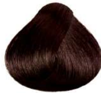
شکلاتی خیلی تیره Intense Brown Brown Castano Marrone Intenso