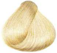
بلوند بژ فوق العاده روشن Extra Light Beige Blonde Biondo Chiarissimo Extra Beige