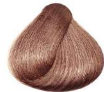
بلوند کاراملی Caramel Blonde Biondo Caramel