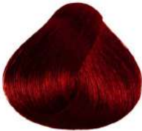
شرابی خیلی تیره Intense Red Brown Castano Rosso Intenso