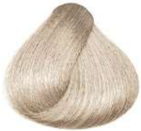
نقره ای Silver Argento