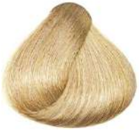
بلوند دودی پلاتینیوم فوق العاده روشن Ultra Light Platinum Ash Blonde Biondo Cenero Platino Ultra Chiaro