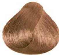
بادامی روشن Light Golden Brown Blonde Biondo Chiaro Dorato Marrone