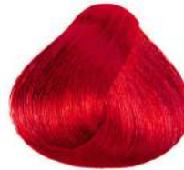
قرمز آتشین Intense Red Blonde Biondo Rosso Intenso