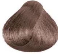
دودی بژ Ash Irisé Blonde Biondo Cenere Irisé