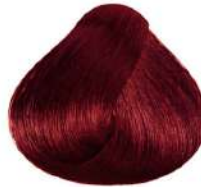
ماهاگونی Red Irisé Blonde Biondo Rosso Irisé