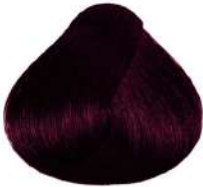
بادمجانی خیلی تیره Violet Brown Castano Viola