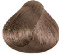
بژ طلایی روشن Light Irisé Golden Blonde Biondo Chiaro Irisé Dorato