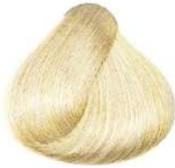
سوپر بلوند فوق العاده روشن Ultra Light Blonde Plus Biondo Ultra Chiaro Plus