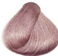
بلوند بنفش Violet Blonde Biondo Viola