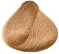
طلایی روشن Light Golden Blonde Biondo Chiaro Dorato