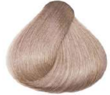
دودی بژ خیلی روشن Very Light Ash Irisé Blonde Biondo Chiarissimo Cenere Irisé