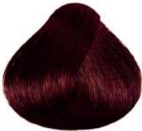
ماهاگونی خیلی تیره Red Irisé Brown Castano Rosso Irisé