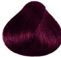
بادمجانی تیره متوسط Dark Violet Blonde Biondo Scuro Viola