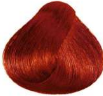
مسی Copper Blonde Biondo Rame